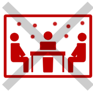
換気の悪い 『密』閉空間

スタジオレッスン開催において、クラスター発生を避ける為に以下の対策を講じさせていただきますのでご理解とご協力をお願いいたします。