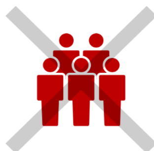
多数が集まる 『密』集場所